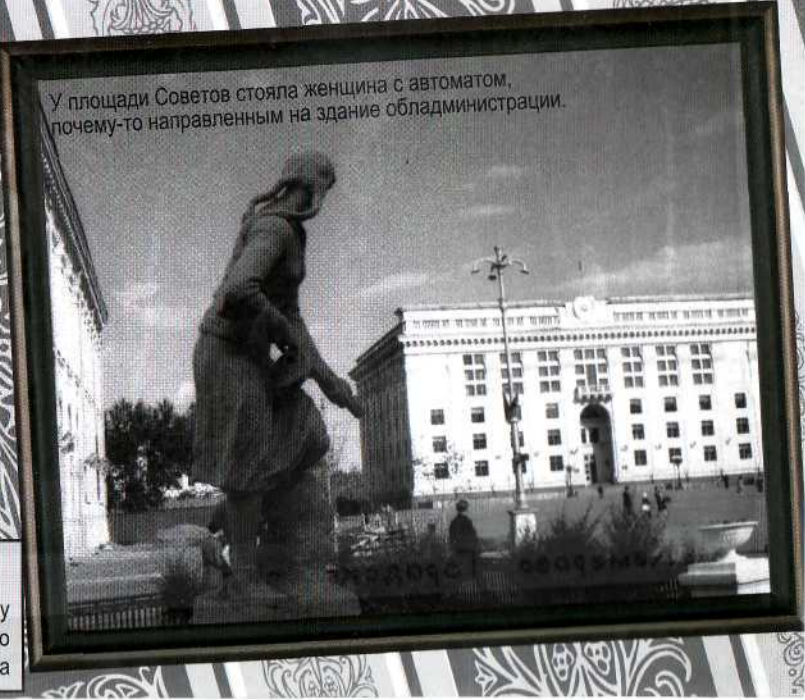
У площади Советов стояла женщина с автоматом, почему-то направленным на здание администрации.