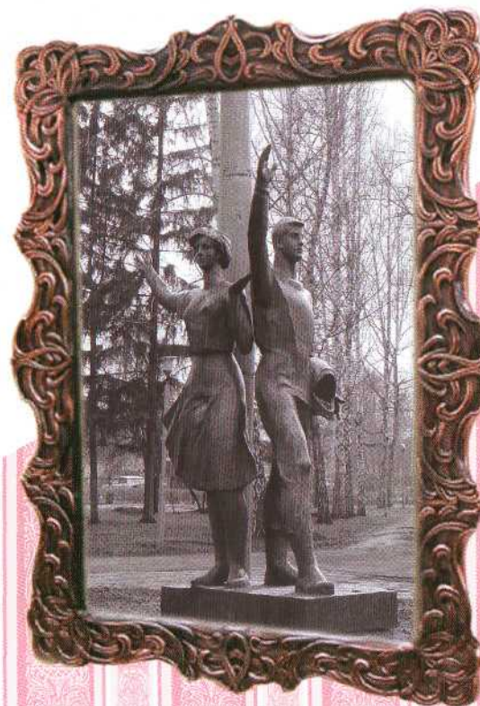
В шлем символического космонавта до чрезвычайности любят засовывать головы и фотографироваться все кому не лень...

Конечно, художественная ценность подобных скульптур невелика, но они дороги многим кемеровчанам как память об облике города было-го времени.