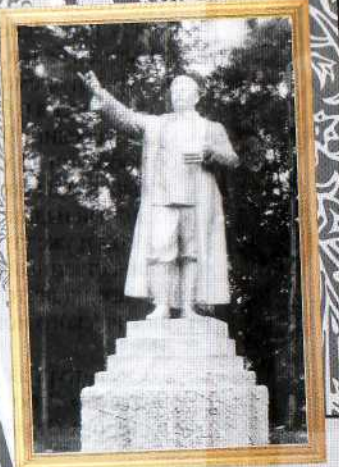
Сталин есть в горсаду и сейчас - закопан где-то на территории парка