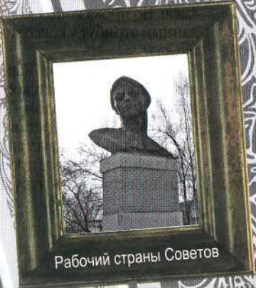
Рабочий страны Советов