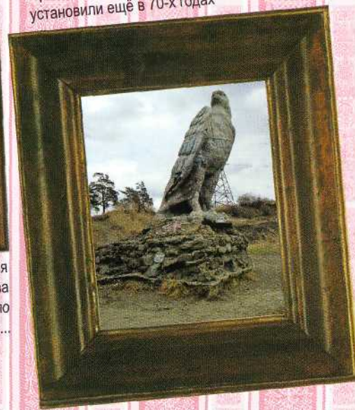
Орла на Лысой горе установили ещё в 70-х годах