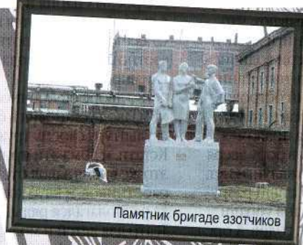
Памятник бригаде азотчиков