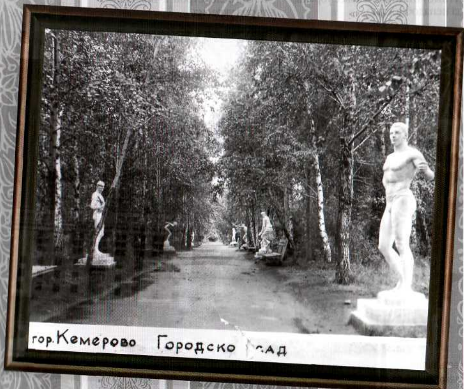
гор. Кемерово Городско сад

И уже пять лет стоят массивные изваяния и пока целы. Шутка ли, вес одной такой фигуры около 4 тонн.