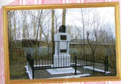
Один из самых странных памятников города посвящен ударникам производства

Гипсовые изваяния украшали весь центр города. У площади Советов стояла женщина с автоматом, почему-то направленным на здание обл администрации. На углу улиц Весенней и Островского была скульптура простого советского парня. Вместо железной девы напротив магазина «Чибис» по ул. 50 лет Октября до недавнего времени стояла гипсовая скульптурная композиция «Машенька и медведь». Гипсовые пионеры трубили в горн около областной библиотеки и во дворе на улице